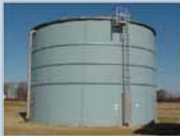
Azul Cielo (Sky Blue)