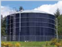
Azul Cobalto (Cobalt Blue)