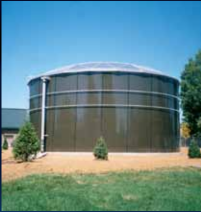
Tanque de Almacenamiento Superficial