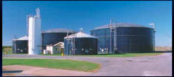
▲ Instalaciones para estabilización y almacenamiento de sedimentos.

Garantía de que usted recibirá la más alta calidad de ingeniería, el mejor servicio, la más larga vida útil del producto y el mejor valor en tanques de almacenamiento de líquido.