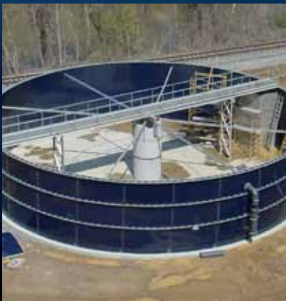
Tratamiento de Aguas Residuales