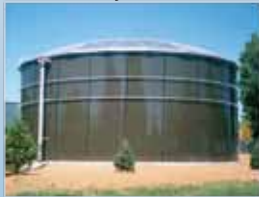
Verde Bosque (Forest Green)