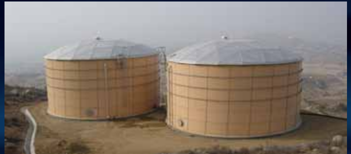
▲ Instalaciones de tanques múltiples de Almacenamiento Potable.