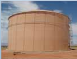
Canela Desierto (Desert Tan)