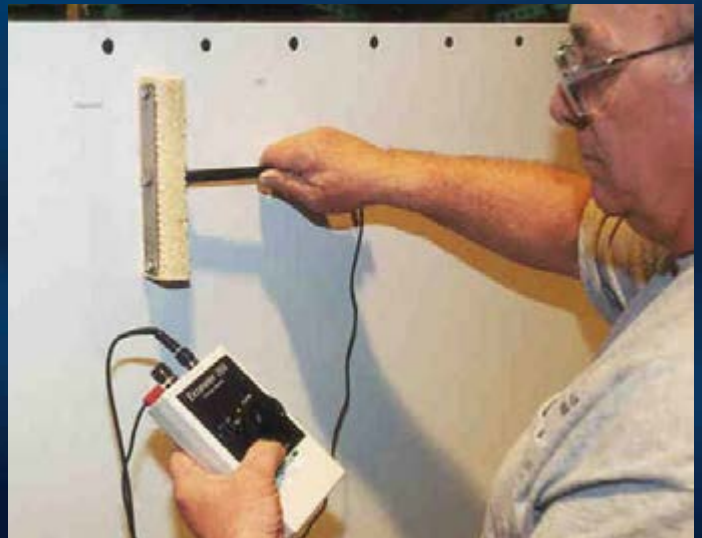
▲ Instalaciones de tanques múltiples de Almacenamiento Potable.