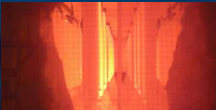
▲ Tecnología de punta en calderas de esmalte de porcelana instalada en 2006.

Una nueva caldera de esmalte de porcelana con tecnología de punta fue instalada en CST en el año 2006. Es la caldera esmalte de porcelana más grande y más eficiente en el mundo, lo que mejora la calidad, ahorra energía, incrementa la producción y acelera la entrega de productos de vidrio fusionado al acero a los clientes y usuarios finales. En total, cinco zonas de control avanzado de temperaturas regulan el proceso de esmaltado para producir consistentemente las láminas de extremada alta calidad. En total, cinco zonas de control avanzado de temperaturas regulan el proceso de esmaltado para producir consistentemente las láminas de extremada alta calidad.